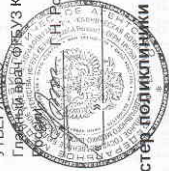
График работы врачей-специалистов и медицинских сестер поликлиники по платным услугам на 2024 год