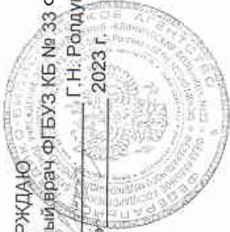
ГРАФИК РАБОТЫ сотрудников платного стоматологического кабинета отделения платных услуг на 2024 год

УТВЕРЖДАЮ Главный врач ФГБУЗ КБ № 33 ФМБА России Г.Н. Ролдугин « _____ » _____ 2023 г.