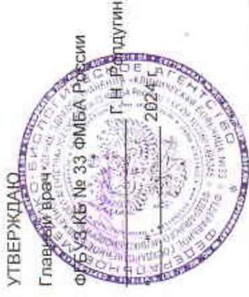
ГРАФИК РАБОТЫ НА 2024 ГОД ЭНДОСКОПИЧЕСКИЙ КАБИНЕТ (платные услуги)